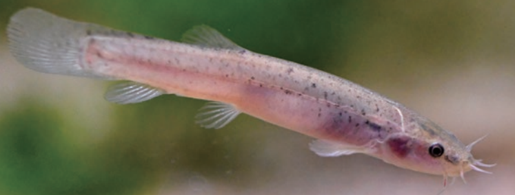
山梨県で絶滅危惧Ⅱ類に指定されているホトケドジョウ